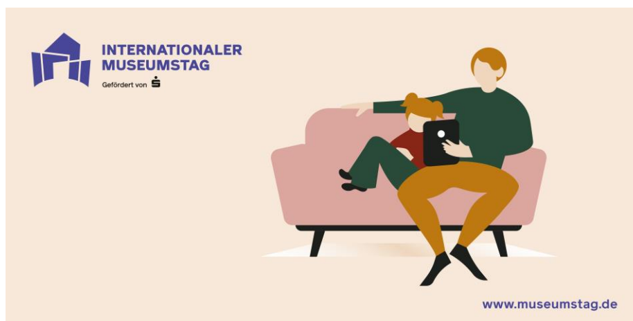
Abbildung zur Medieninformation

Weitere Informationen zum Internationalen Museumstag erhalten Sie unter www.museumstag.de oder in den sozialen Medien unter dem Hashtag #MuseenEntdecken.