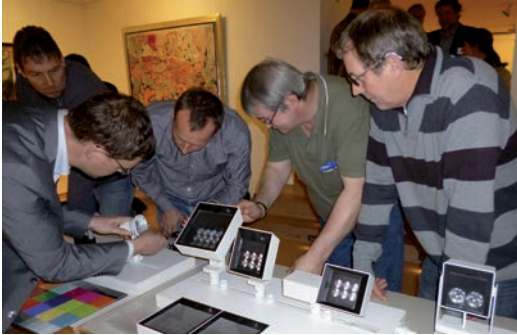
Workshop zum Thema Licht in der Ausstellung in der Kunsthalle Emden, 2012