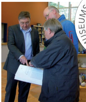
Persönliche Beratung vor Ort - eine der Leistungen des MVNB für Teilnehmer am Museumsgütesiegel